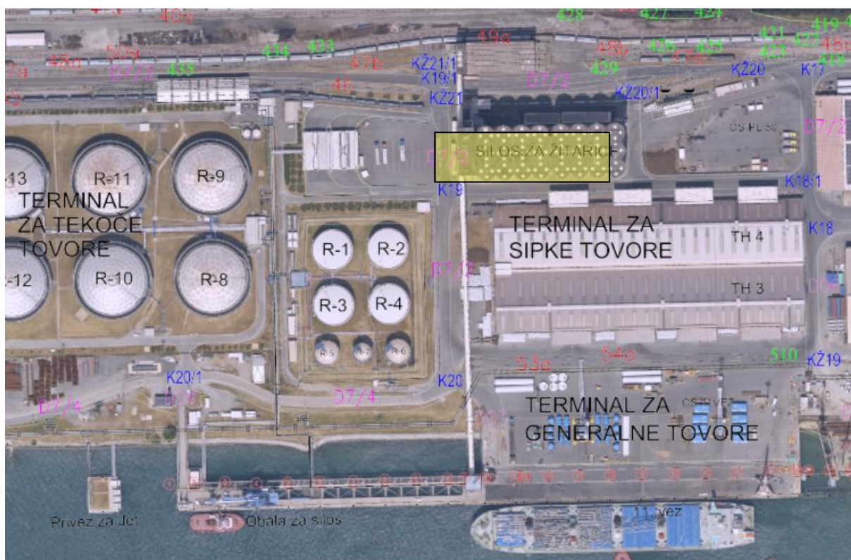
Slika 1: Območje izvedbe (označeno z rumeno)

Lokacija izvedbe: Luka Koper d.d., Terminal za sipke tovore – odprema prahu preko tehtnice B, na silosu za žita na pomolu II.